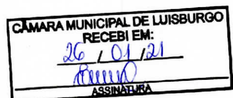
Otenides dos Santos Hott Praça Prefeito Municipal

Gabinete do Prefeito de Luisburgo, 25 de janeiro de 2020.